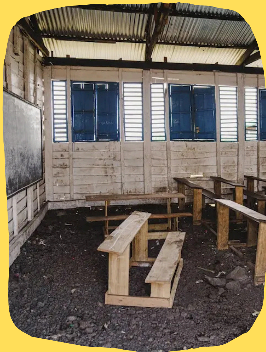
Un aula vacía en la escuela primaria de Bulengo, apoyada por UNICEF, en el campamento de desplazados de Bulengo, cerca de Goma, provincia de Kivu del Norte, República Democrática del Congo, el 10 de febrero de 2025.

Este enfoque también requiere una colaboración y movilización de esfuerzos entre los diferentes sectores y sus partes interesadas para garantizar un enfoque y una evaluación conjunta de las necesidades humanitarias y la movilización de recursos (OCHA, 2024). A pesar de los avances logrados en los últimos diez años, la situación de los niños, niñas y mujeres en la RDC sigue siendo precaria. Desafortunadamente, las necesidades específicas de los niños, niñas y adolescentes rara vez se consideran prioritarias. No son solo los beneficiarios de los servicios destinados a hacer frente a las dificultades que enfrentan. También desempeñan el papel de actores en el proceso de mejorar su bienestar y son los garantes del futuro del país. Al aplicar este principio, según el grado de madurez de cada niño, es posible promover el derecho a la participación de cada niño y adolescente, al mismo tiempo que se crea un entorno propicio para ello (UNICEF, 2017).